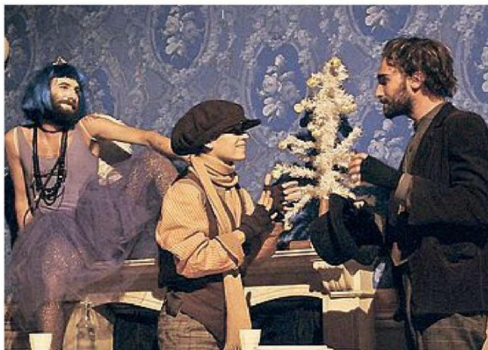
TEATRO Scatta la rassegna Piccolo Sipario dedicata alle scuole e alle famiglie. Il primo appuntamento è «Canto di Natale»

Gli spettatori guidati dal timido narratore, verranno accolti, tra le note della musica originale di Gabriele Rendina, da tre fantasmi del Natale passato, presente e futuro, in un continuo vagare nei luoghi della memoria di Scrooge. La giovane compagnia darà forma ad un racconto capace ogni volta di rinnovarsi, che fa appello ad un universo immaginifico sempre nuovo, realizzato grazie alle scene di Alessandra Muschella e i fedeli costumi di Arianna Pioppi. Canto di Natale è una delle opere più famose e popolari di Charles Dickens. Una favola sull'importanza del Natale e sulla riscoperta dei sentimenti.